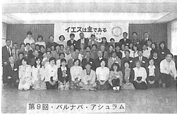
第9回・バルナバ・アシラム

五月二日〜四日の三日間、東京日野市、ラ・サール研究所で開催の第九回バルナバ・アシラムは七十名参加、内四割二十六名が初参加、教職